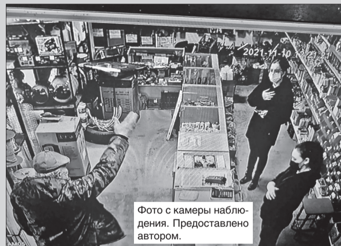
Фото с камеры наблюдения. Предоставлено автором.