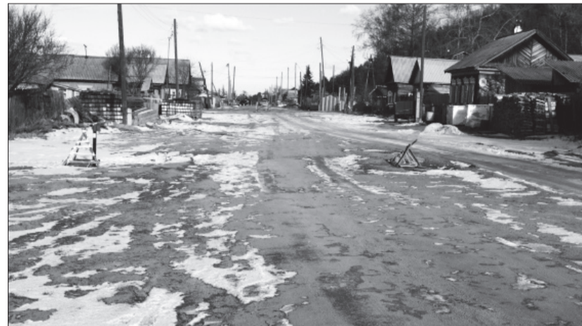
У туркичанцев на смену одной проблемы пришла другая.

ли жителям Турки водовод, мы сдали самим туркичанам.