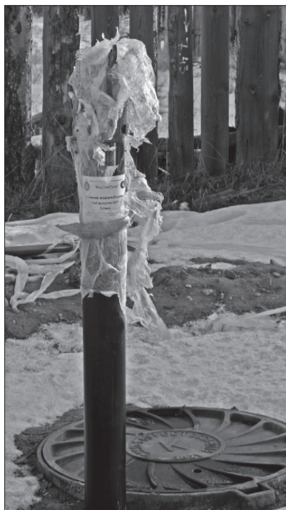
«ВодТехПром» Колонка водоразборная. Год выпуска 2021. г. Омск.