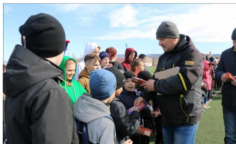
Шоколада хватило всем!