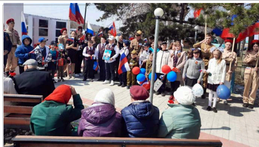
Митинг в с. Троицкое.