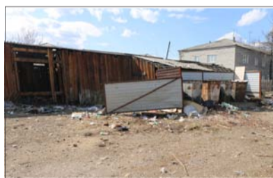
«Вечная» свалка между улицами Юбилейная и Спортивная..