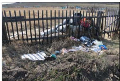
У ограды старого кладбища.