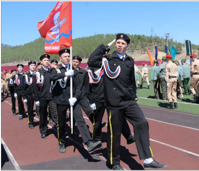
В парадном строю победители игры - команда гимназии.