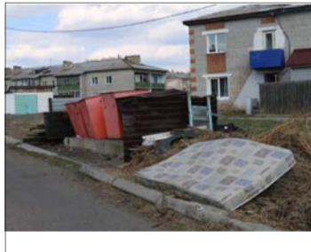
1-й квартал, западная сторона.