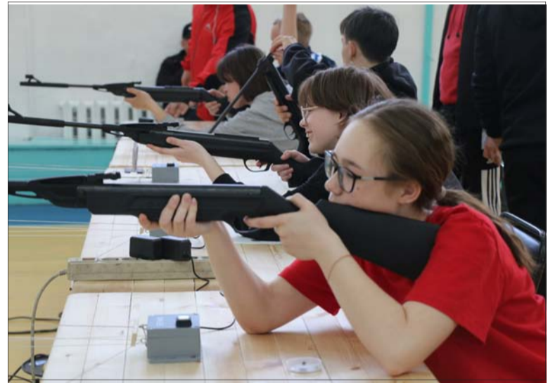
Девушки стреляют не хуже парней.