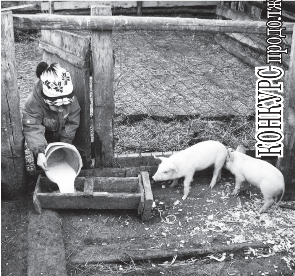
«Пейте, свинки, молоко - будете большими!»